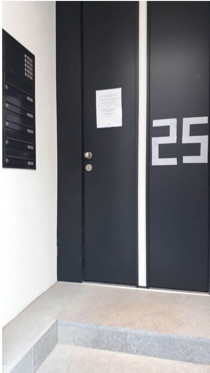
Eingang Gurlittstraße 25